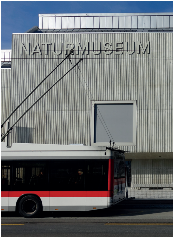
Gebäudebeschriftung Naturmuseum St. Gallen © Bivgrafik GmbH